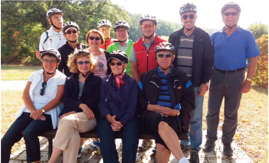
Die Teilnehmer der Radtour 2018 „Zautendorf“

Ich denke, dass alle ihre Freude hatten und es ein gelungener Tag war.