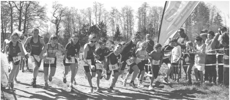
1000m Laufen 4,5km Rad fahren und 400m Laufen hatten alle anderen Altersklassen zu absolvieren