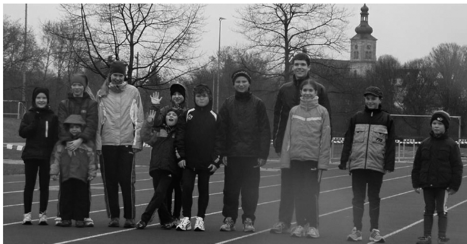
Kurze Erholung zwischen dem Schwimmen und dem Laufen auf der Sportinsel

Zunächst galt es über verschiedene Distanzen, abhängig von der Altersklasse, eine Schwimmstrecke im Hallenbad zurückzulegen. Anschließend war Pause und nach den Ergebnissen aus dem Schwimmen erfolgte mit Jagdstart der Laufwettkampf.